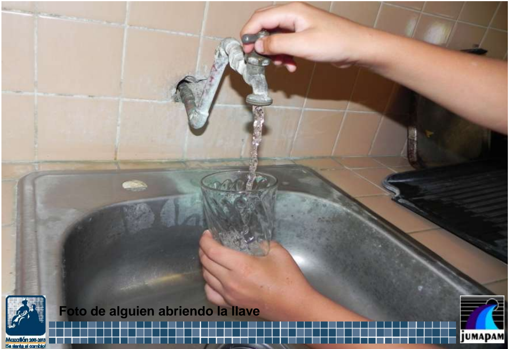
Foto de alguien abriendo la llave