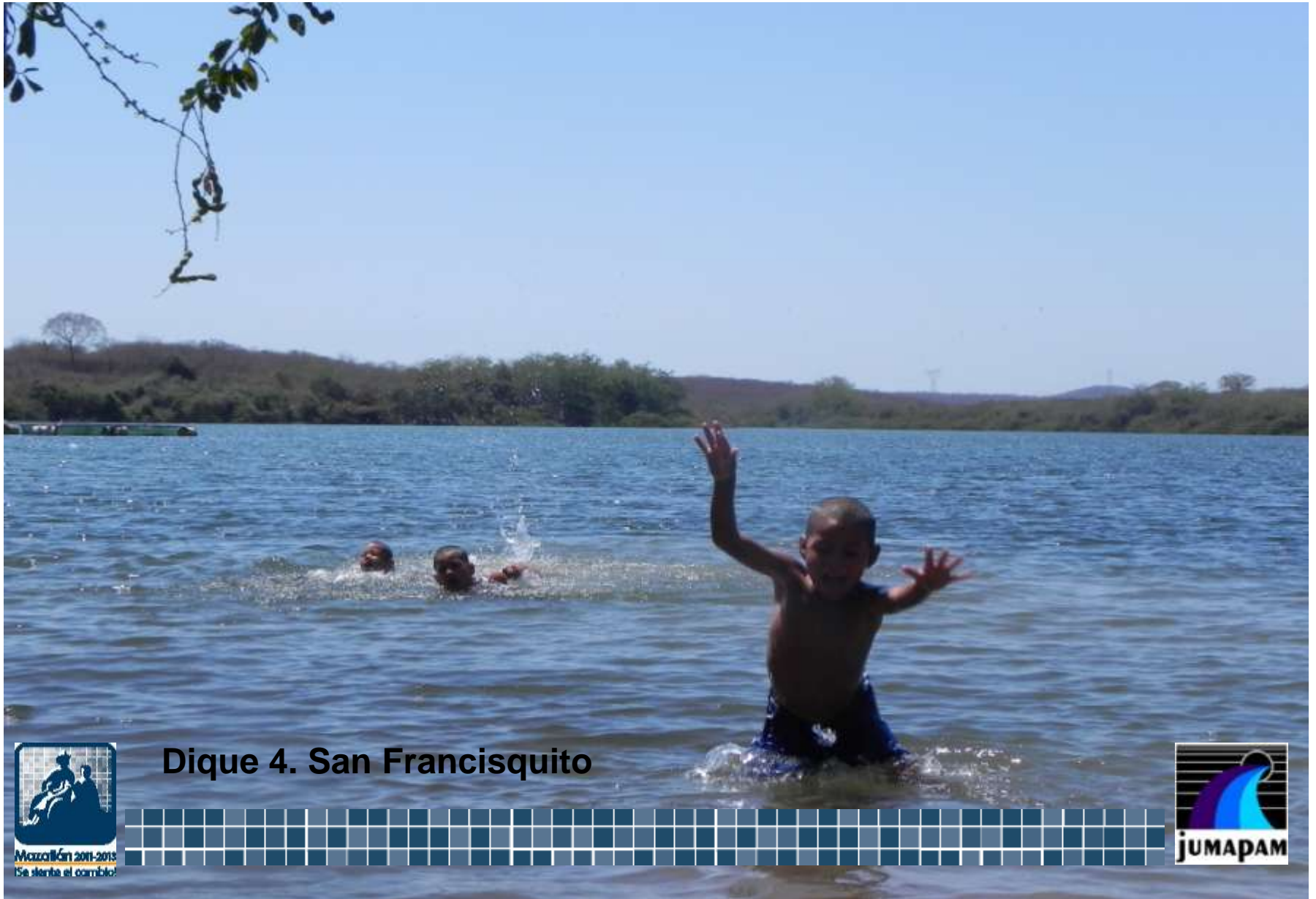
Dique 4. San Francisquito