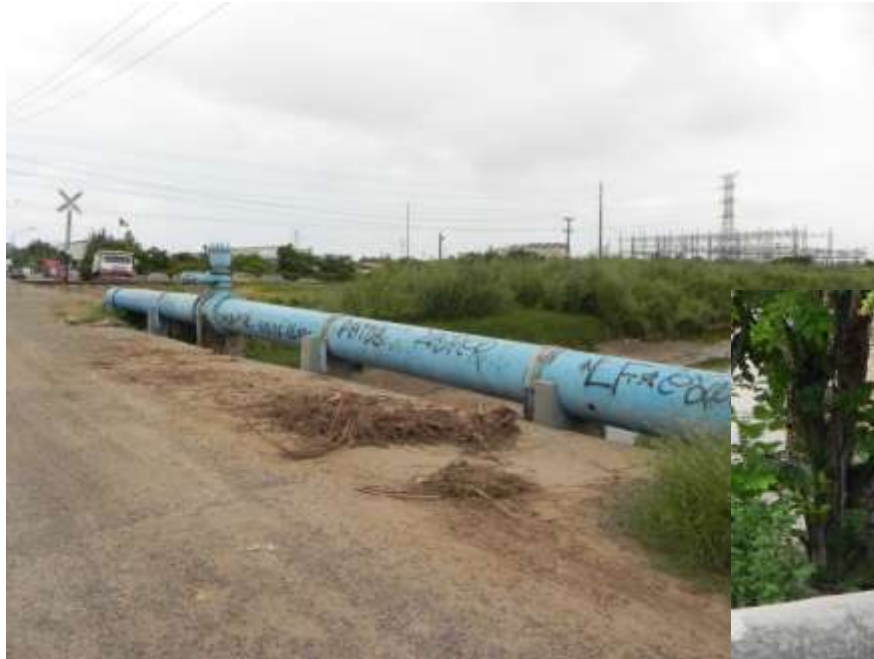
Línea de acero