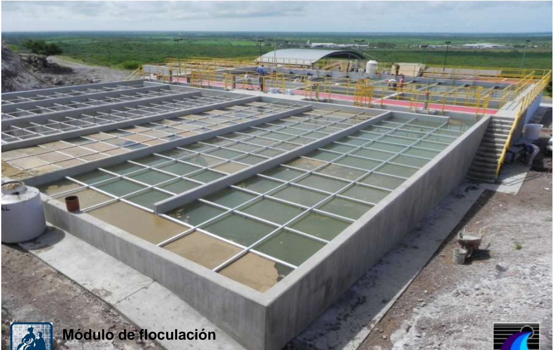
Módulo de floculación