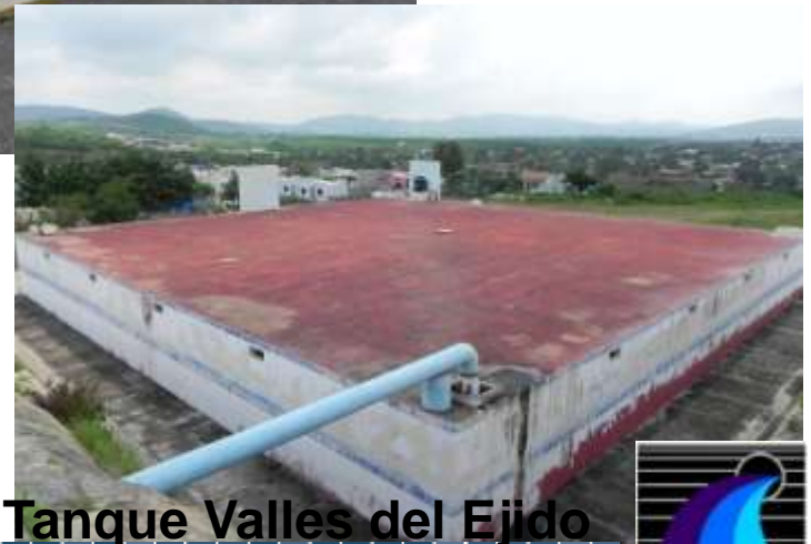
Tanque Valles del Ejido