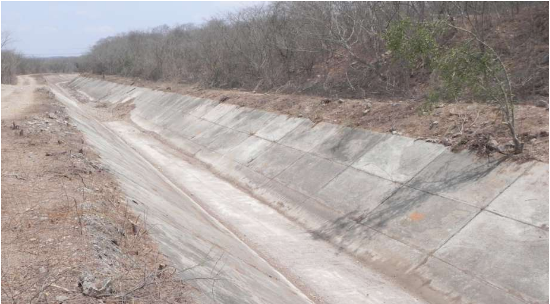
Canal de riego en la primera limpieza