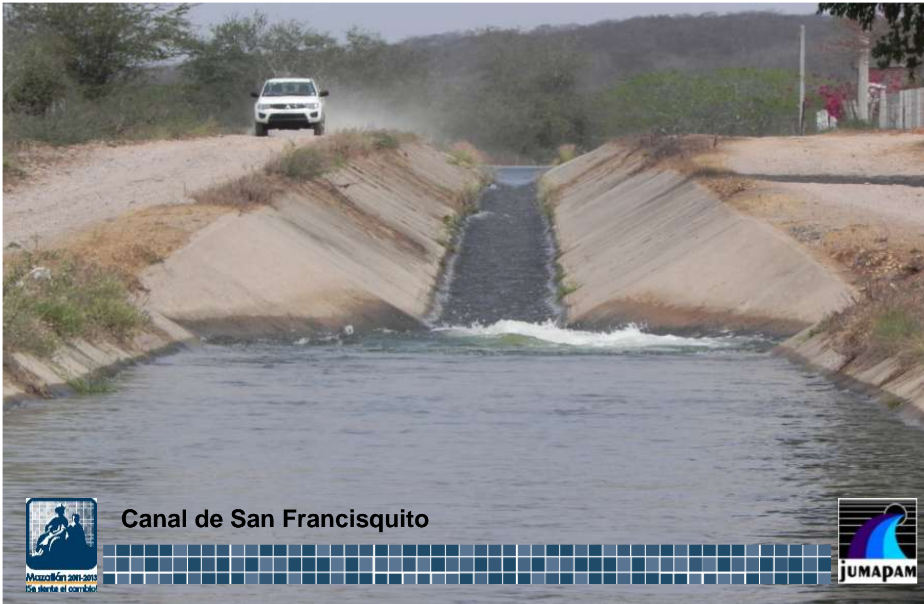
Canal de San Francisquito