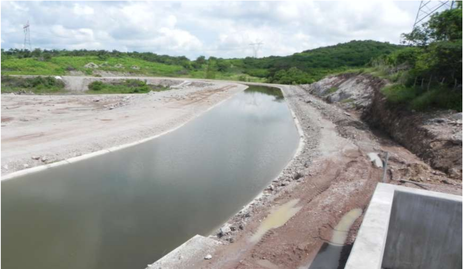
Entrada del agua del canal a la Planta Los Horcones