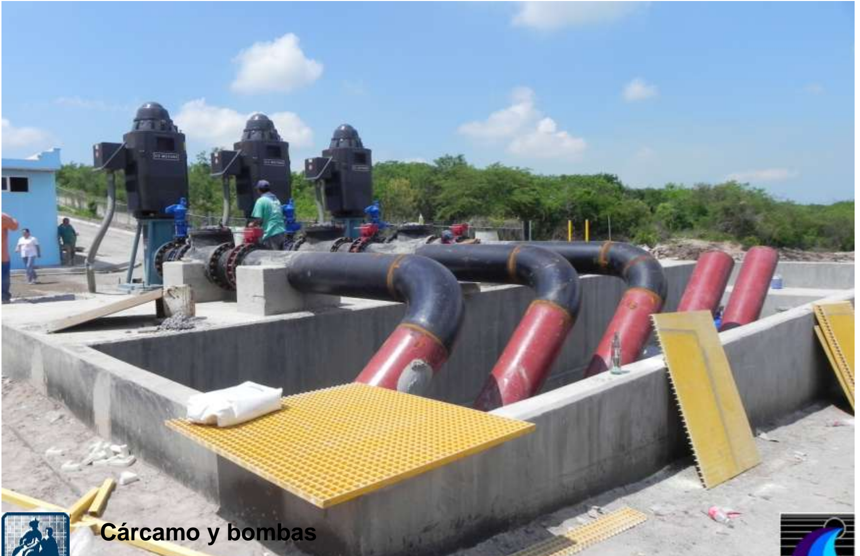
Cárcamo y bombas