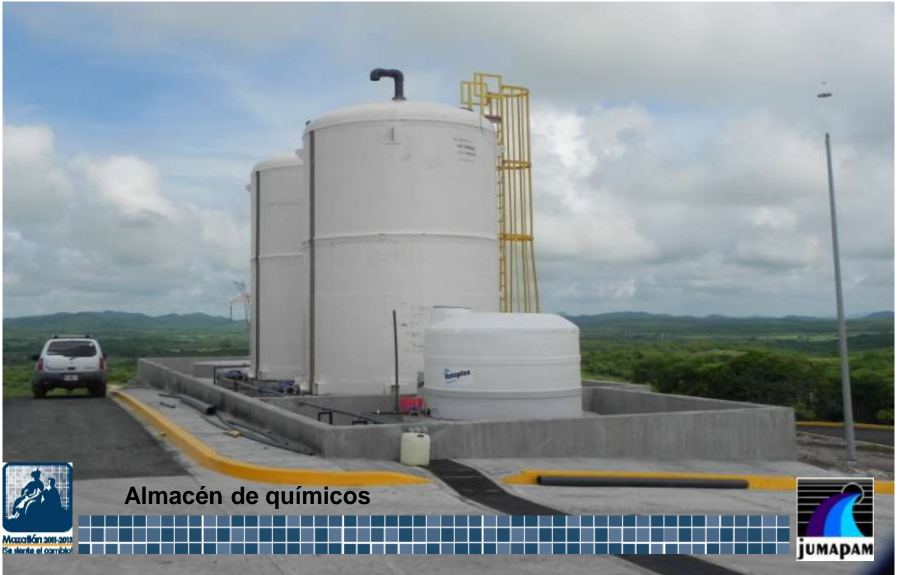
Almacén de químicos