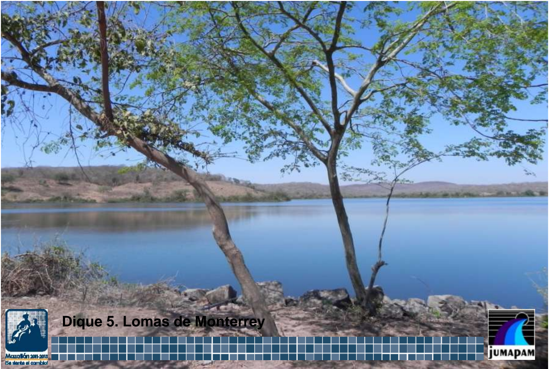
Dique 5. Lomas de Monterrey