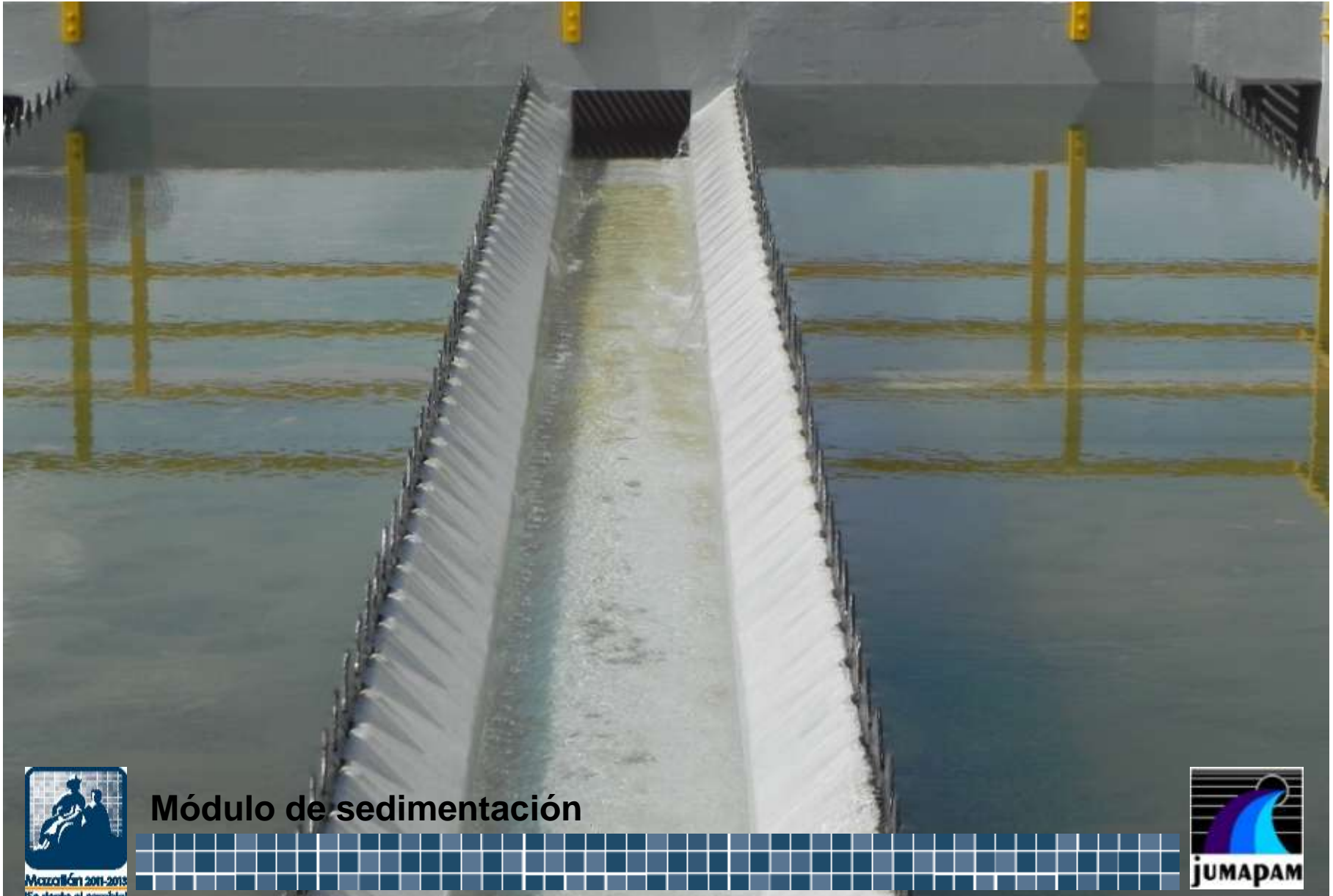
Módulo de sedimentación